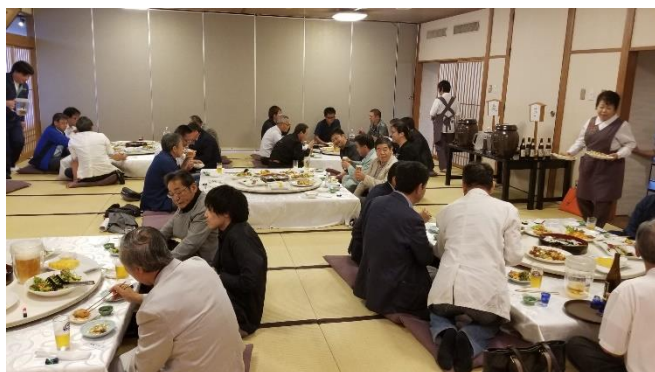
(賛助会員との懇親会の様子)